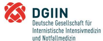
Deutsche Gesellschaft für Internistische Intensivmedizin und Notfallmedizin e.V. (DGIIN)