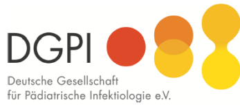
Deutsche Gesellschaft für Pädiatrische Infektiologie e.V. (DGPI)