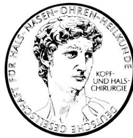
Deutsche Gesellschaft für Hals- Nasen- Ohren-Heilkunde, Kopf- und Hals-Chirurgie e.V. (DGHNO-KHC)